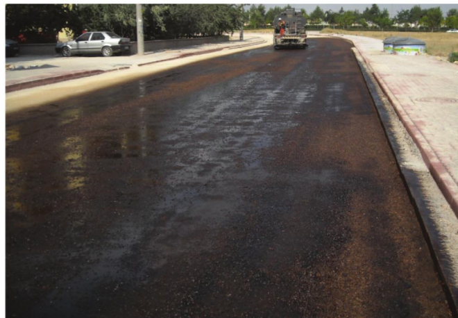
تراپریم به همراه قیر امولسیون کاتیونی